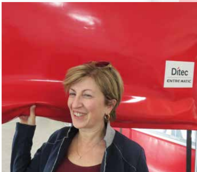
Puha alsó él

A 32 karakteres kijelzővel ellátott vezérlő panel lesz az Ön legmegbízhatóbb asszisztense, mely folyamatos állapot jelentést biztosít a kapu aktuális működéséről. Egyszerűen beállítható menüvel és karbantartási tervezettel lett ellátva. A kurbilis kioldónak köszönhetően, Ön bármikor manuálisan működtetheti a kaput, például áramszünet esetén.