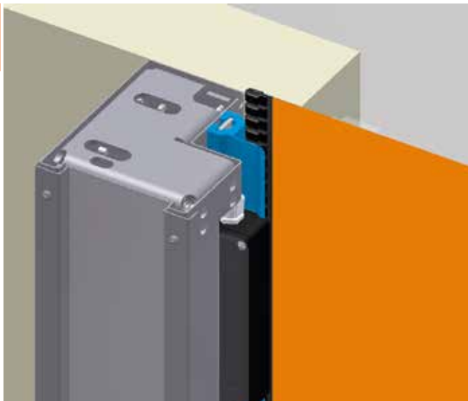
Öntesztelő biztonsági rendszer

A speciális sín megvezetőknék és a zip-zár technikának köszönhetően a kapu működése halk.