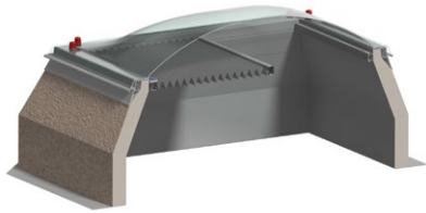
Egy árnyékoló rögzített felülvilágító kupola metszeti nézete