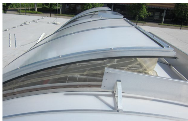
Sávos felülvilágító szárny szellőztető pozícióban, rovarháló rendszerrel