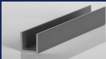
Eloxált U-Profilok E6/C0 15 µ EN AW-6060 T66 (AlMgSi)