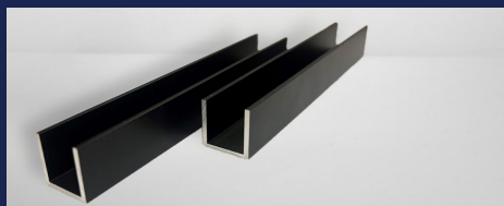
U-profilok fekete eloxált E6/C35 15 μ EN AW-6060 T66 (AlMgSi)