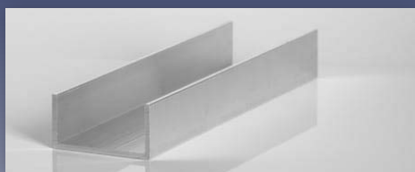
Nemesacél hatású eloxált U-Profilok EN AW-6060 T66 (AlMgSi)