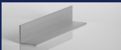
Eloxált L-Profilok E6/C0 15 μ EN AW-6060 T66 (AlMgSi)