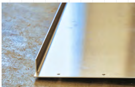
A méretre vágott munkadarab precízen, a kívánt formára hajlítva