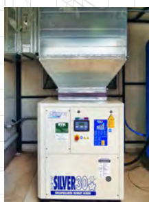
New Silver 30 kompresszor