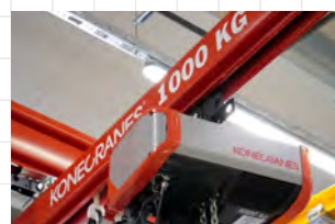
KoneCranes 1000 kg futódaru