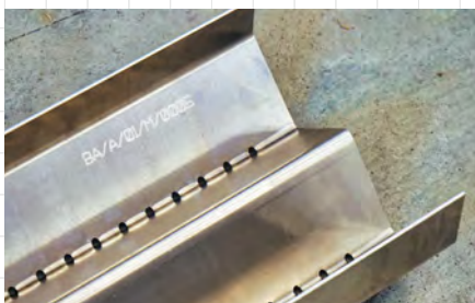
BoostAir® csepegtetőtálca - alumíniumból készült, gravírozott felületű, lézervágott és élhajlított