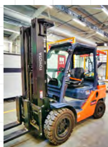
Toyota Toneró 3,5 t targonca