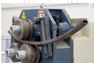
Vendo Durma HPK 40 hidraulikus idom- és csőhajlítógép