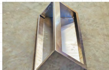
Boostair® légbeszívó ház fedéllel