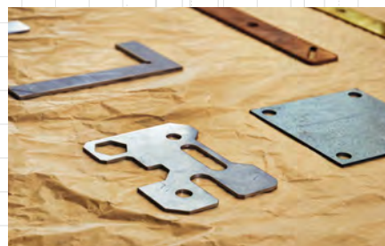
Lézervágó gépünk többfajta fémből szinte minden alakzatot ki tud vágni